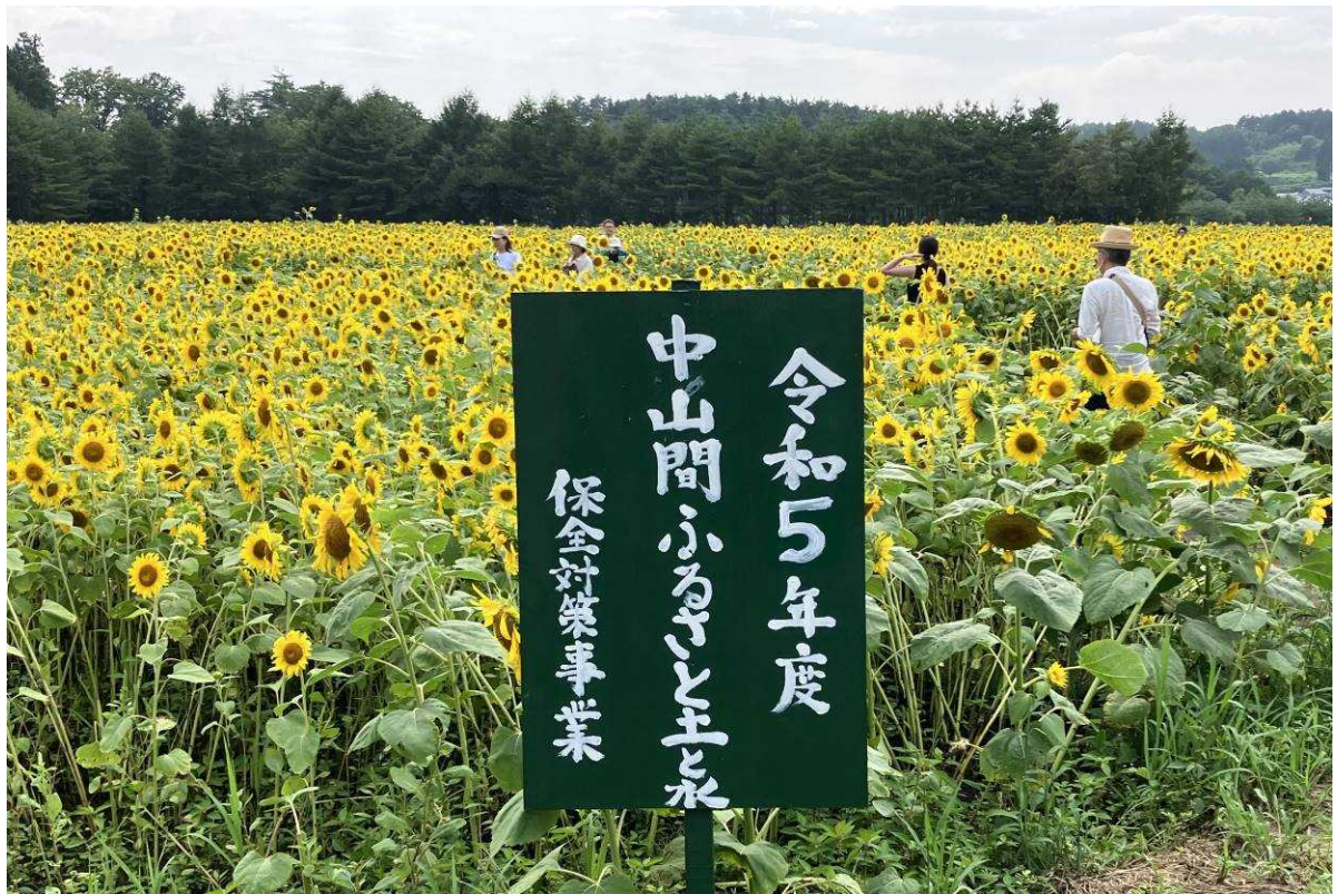
【訪れた人は思い思いに楽しめます】