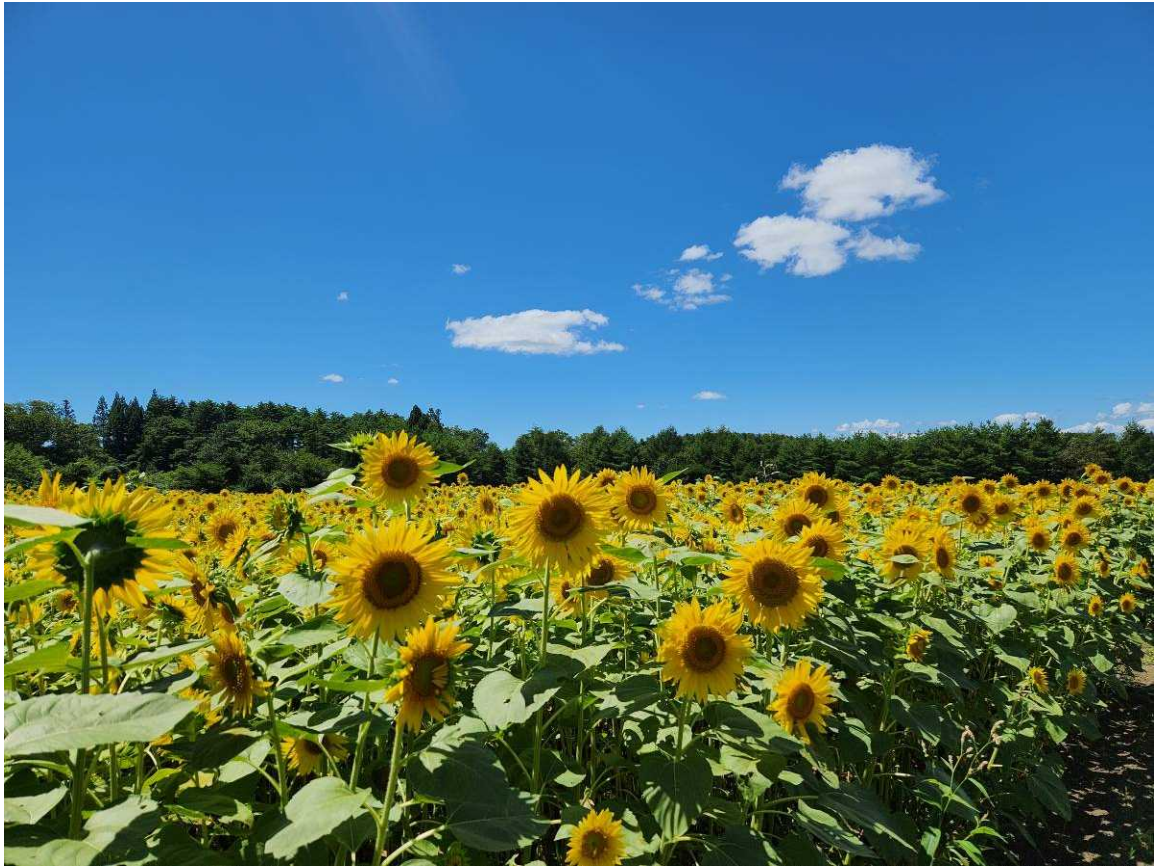
【力強く咲くひまわり】