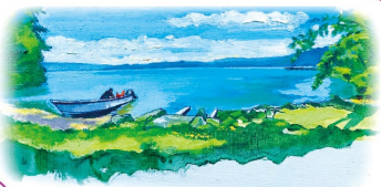
擁有姬鱒湖游河口的湖岸

此區有十和田湖名產「姬鱒」的孵化場，以及秋田杉木材建造、氛圍莊嚴的十和田飯店，亦有矗立在步道邊的禮拜堂等，可感受到近代的歷史與傳統。