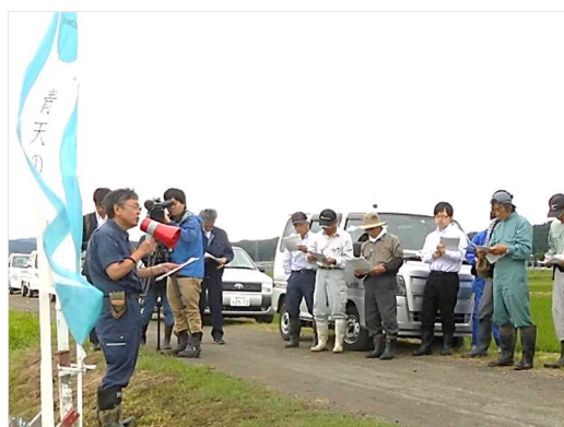
青天の霹靂現地講習会

また、農業普及振興室では、毎年度、「攻めの農林水産業」と連携して「普及指導計画」を定め、地域農業の振興と地域の活性化を支援しております。