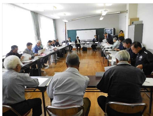
集落営農ネットワーク協議会