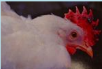
肉冠の出血・壊死