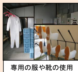
専用の服や靴の使用