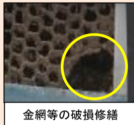
金網等の破損修繕