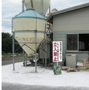
(農場出入口の消石灰帯)