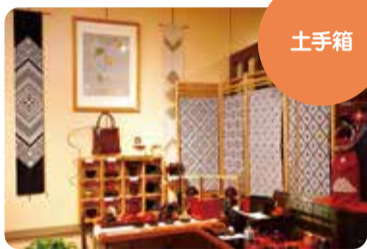
手工制作的工艺品多种多样 【土手箱】

刺绣图案一直用于给工作服加厚、加固和进行装饰，这一“在有限条件下孕育出的朴素之美”，如今在津轻地区人民的日常生活中仍随处可见。