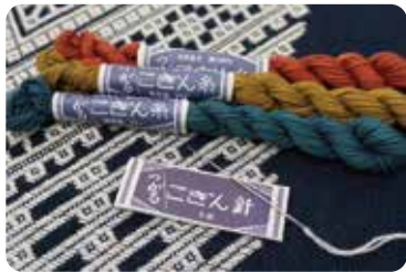
原创布料、针线等品类丰富 【手工商店TSUKIYA】