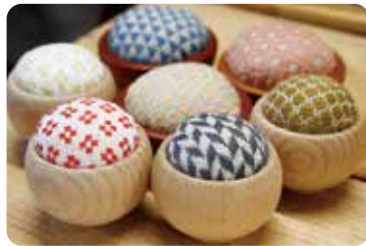
邂逅青森县内外艺术家的作品 【津轻工房社】