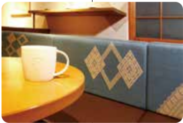
小巾刺绣与洋馆相得益彰 【星巴克弘前公园前店】