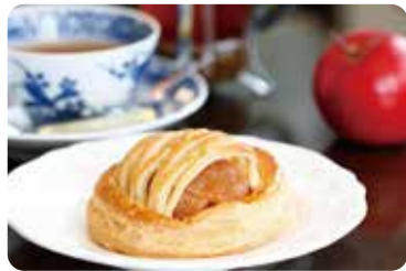
苹果派超好吃 【大正浪漫茶室】