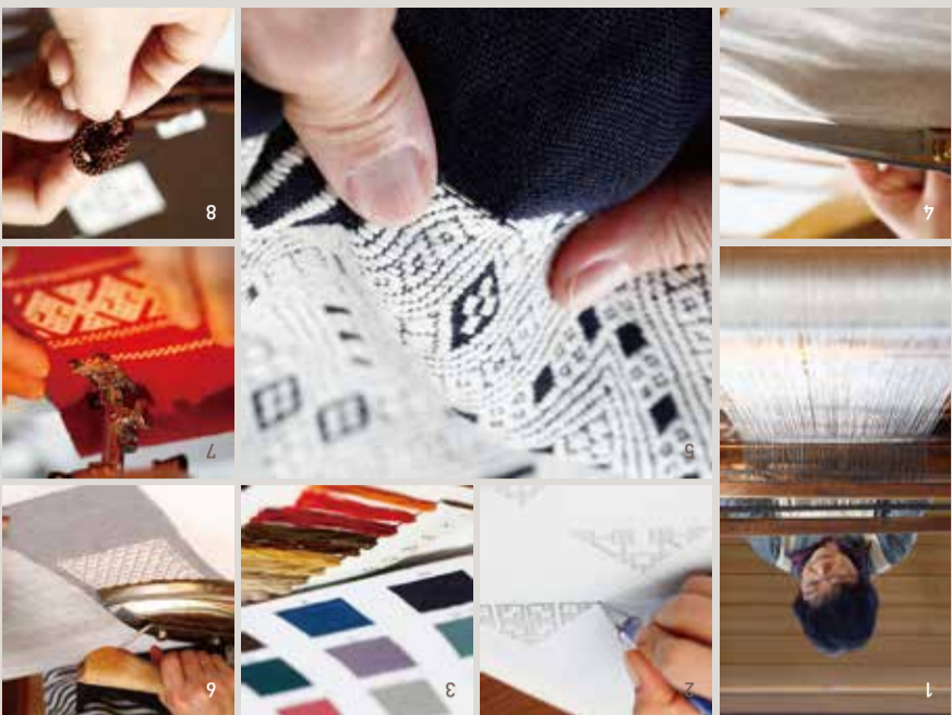
【小巾刺绣的制作工序】1.织布 2.设计图案 3.选线 4.剪裁 5.刺绣 6.熨烫 7.加工 8.收尾

在过去，农民以野生的麻和苧麻为材料纺织布，然后在前襟后背处绣上小巾刺绣，制成带有小巾刺绣的工作服。在弘前小巾研究所(1962年设立)可以参观学习麻布的纺织、剪裁、刺绣、收尾等制作小巾刺绣的各道工序。除此之外，这里还接受各种定制。