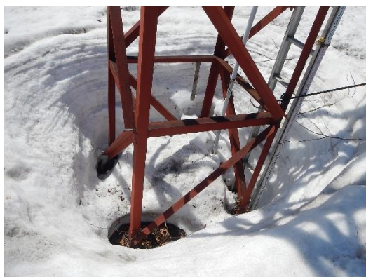
鉄塔の根本は地面が見えていました。