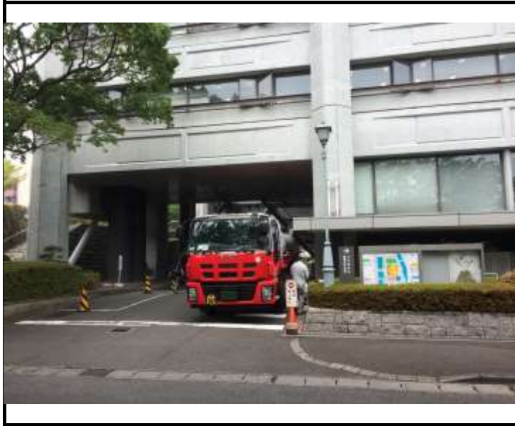
写真1 ローリー停車位置