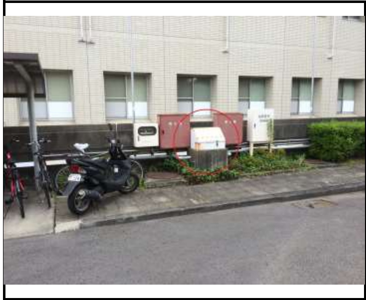
写真2 給油口ボックスの位置