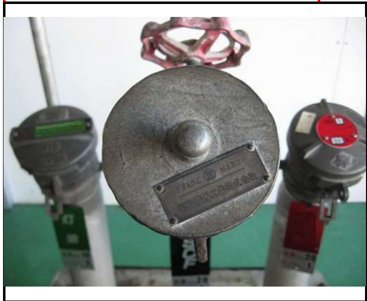
キャップを撮影 型番が刻印されている場合あり