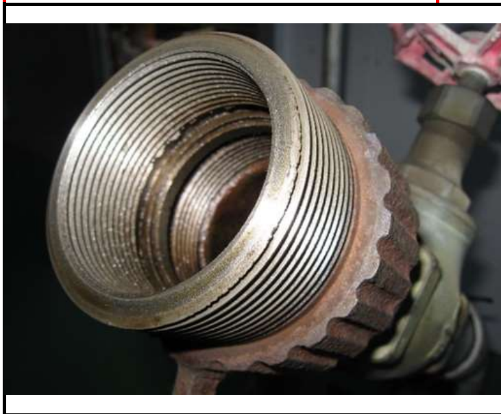
ネジ部(もしくはツメがかかる部分)を撮影