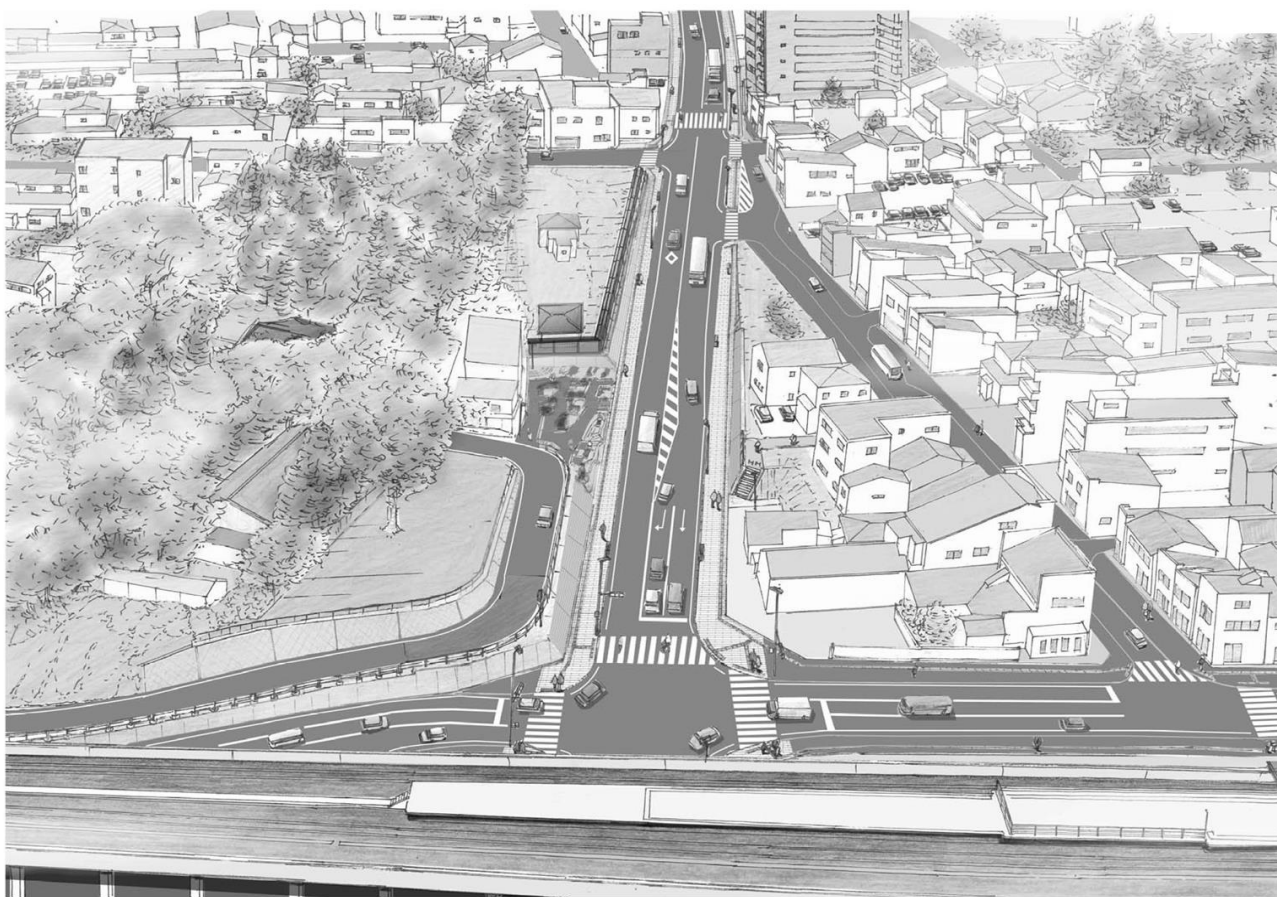
八戸市都市計画道路 3・5・1号沼館三日町線