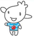
青森空港キャラクター ひこりん