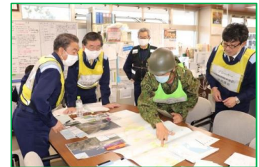
災害対策図上訓練

※対策の代表箇所を旗揚げしている(全域で取組む対策は省略)。 ※「堤防強化」「伐採・掘削」は該当河川の位置を旗揚げしている。 ※具体的な対策内容については、今後の調査・検討等により変更となる場合がある。