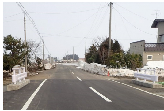
前坂藤崎線 前坂橋 舗装打替、高欄取替