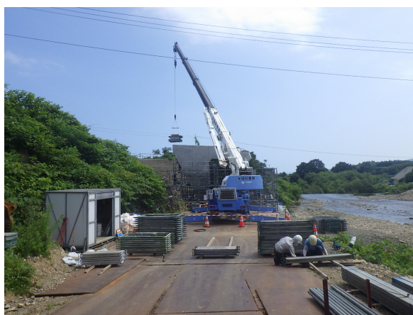
三厩停車場龍飛崎線 新增川川橋 橋台施工状況