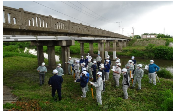
橋梁定期点検研修の様子（6月2日～3日）