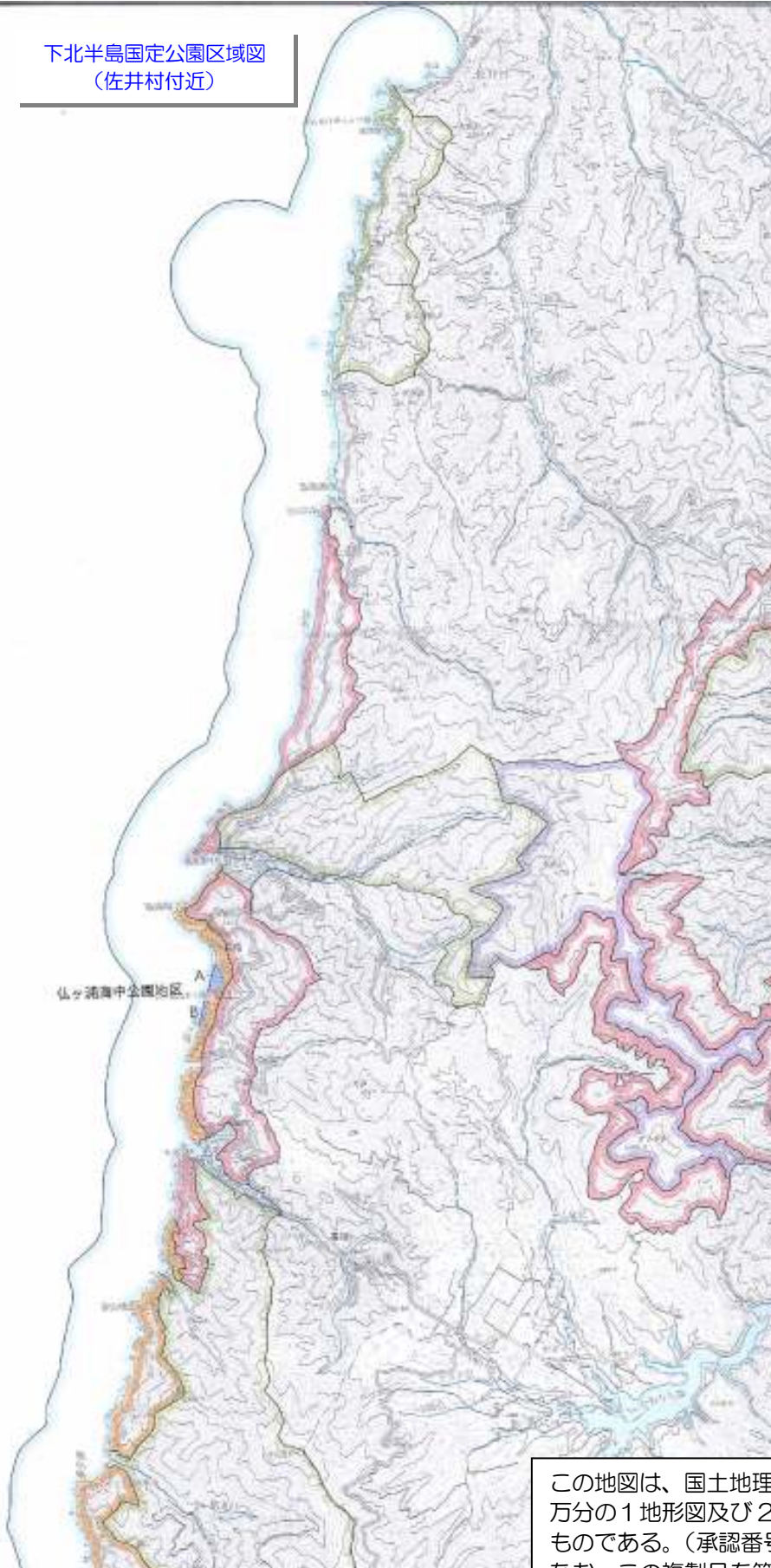
下北半島国立公園区域図 (佐井村付近)

確認してみましょう。 住まいや事業所の場所、工事現場が 公園区域に入っていないか？