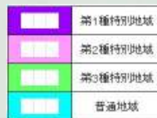
浅虫夏泊県立自然公園区域図 (平内町付近)

この地図は、国土地理院長の承認を得て、同院発行の5万分の1地形図及び2万5千分の1地形図を複製したものである。(承認番号 平27東複、第24号)