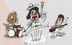
食品ロス削減キャラクター 「ゴミヘルズ」