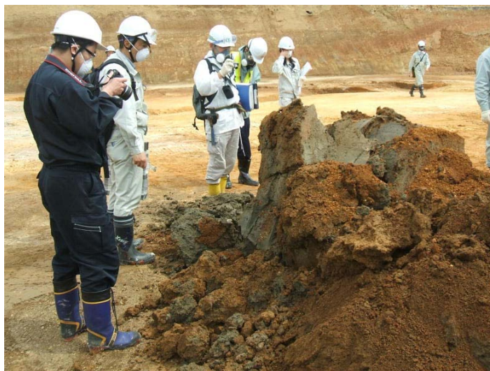
試掘 (b) 状況