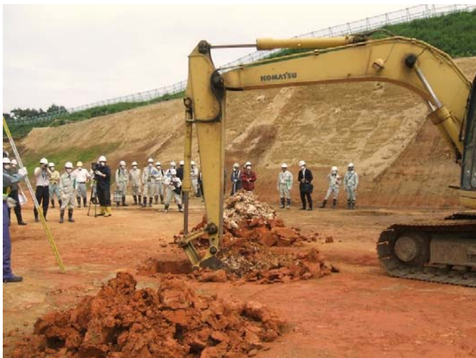
試掘 (a) 状況