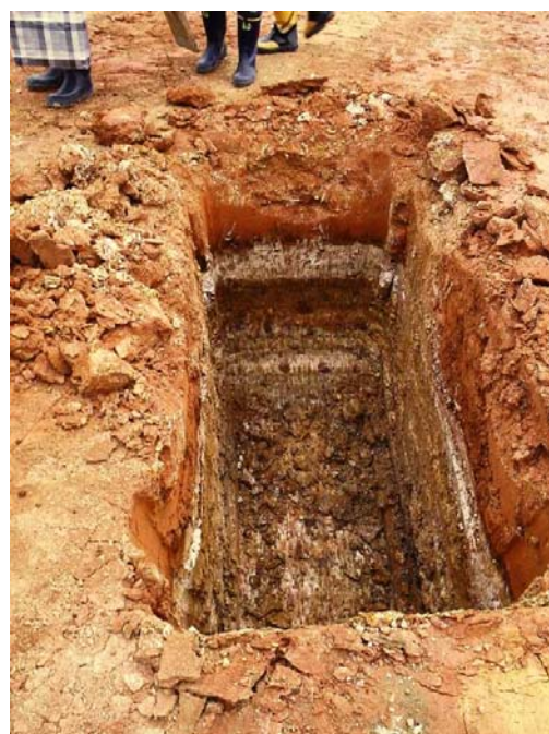
試掘 (a) 完了 (H=2.0m)