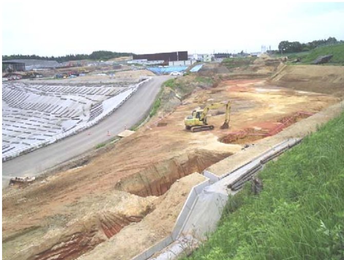
地山確認範囲の全景