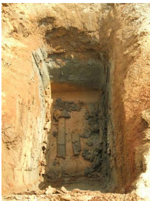
試掘 (b) 完了 (H=2.0m)