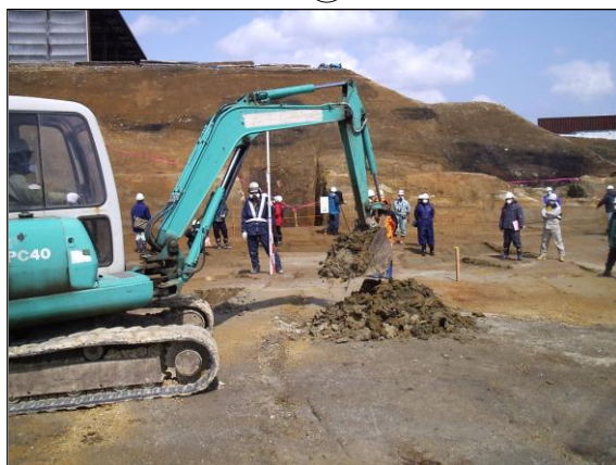
試掘 (b) 状況