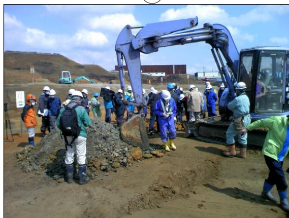
試掘 (a) 状況