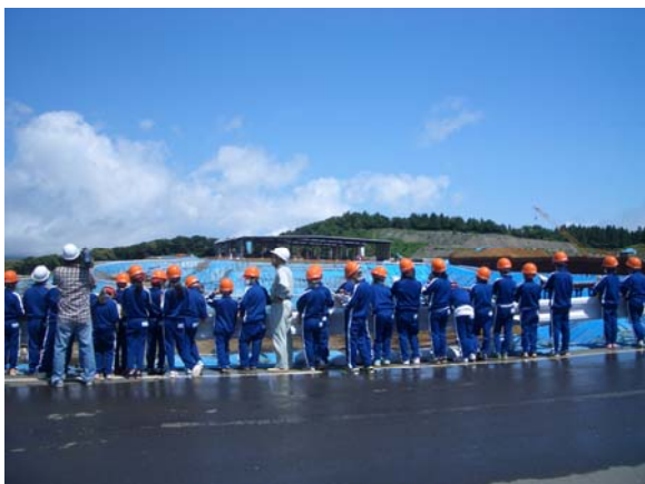
田子小学校4年生(不法投棄現場見学)