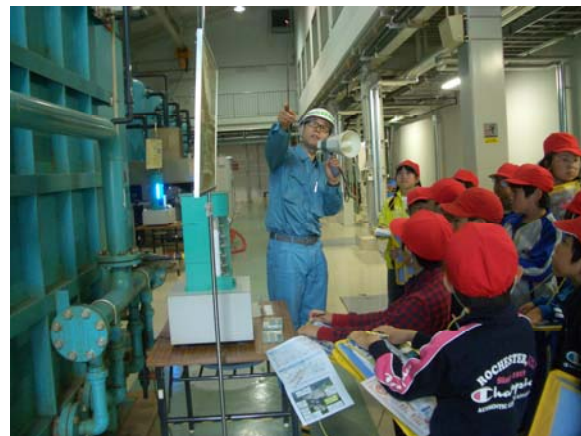
上郷小学校3～4年生(浸出水処理施設見学)