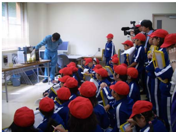
田子小学校4年生(浸出水処理施設見学)