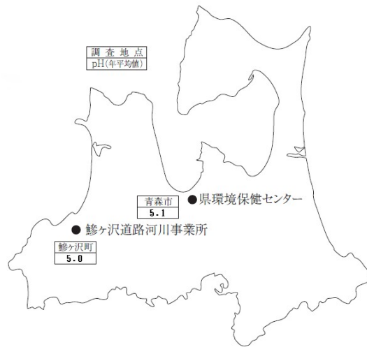
図1 令和3年度酸性雨調査結果(年平均値)

令和3年度の調査結果は図1のとおりであり、酸性雨(pH5.6以下の雨)が観測されています。なお、この測定値は、環境省が公表した「越境大気汚染・酸性雨長期モニタリング報告書」における平成25～29年度の地点別年平均値4.58～5.16(全地点平均値4.77)の範囲内の値となっています。