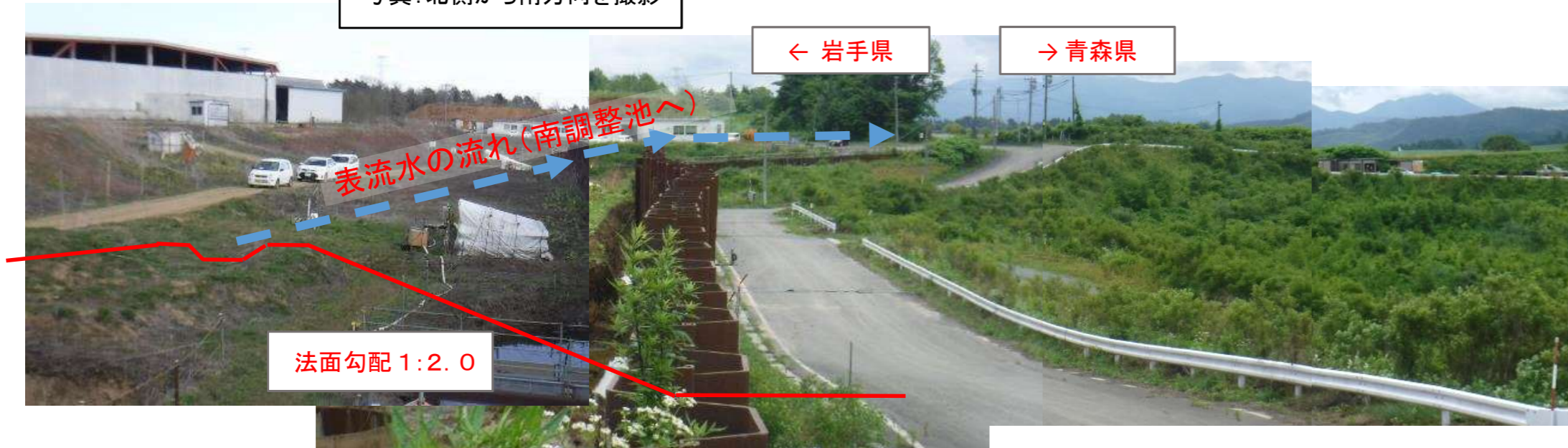
写真: 北側から南方向を撮影