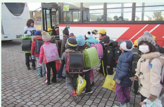
東通小・中学校通学バス運行委託事業(東通村)