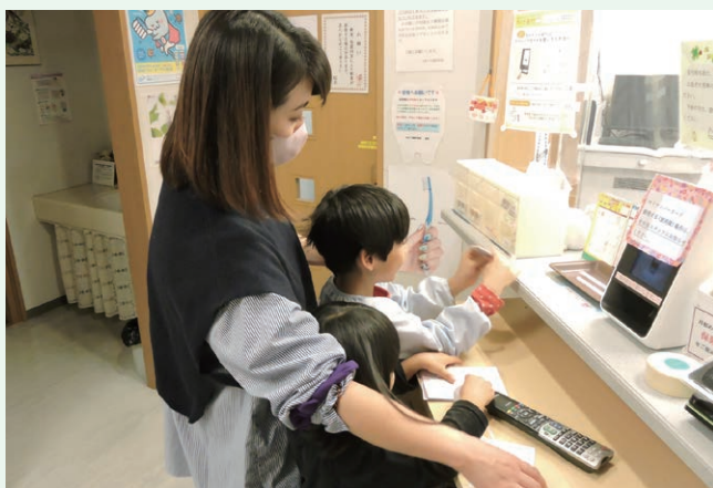
六戸町子ども医療費助成事業(六戸町)