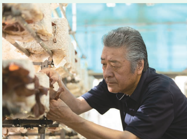
青森さくらげ認知度向上・普及拡大対策事業(全県)