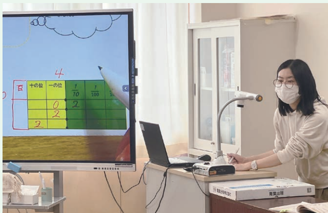
学力向上推進事業(六ヶ所村)