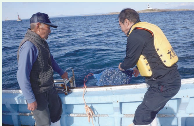
種苗生産事業(大間町)