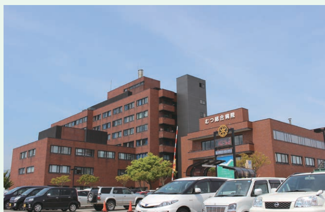
むつ総合病院運営事業(下北医療センター)