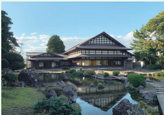
かねひらなりえん さわなりえん 名勝金平成園(澤成園)保存活用事業(黒石市)