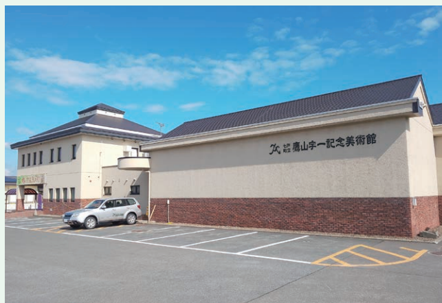
七戸町美術館等維持運営事業(七戸町)