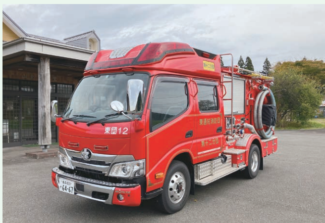
東通村消防ポンプ自動車整備事業(東通村)