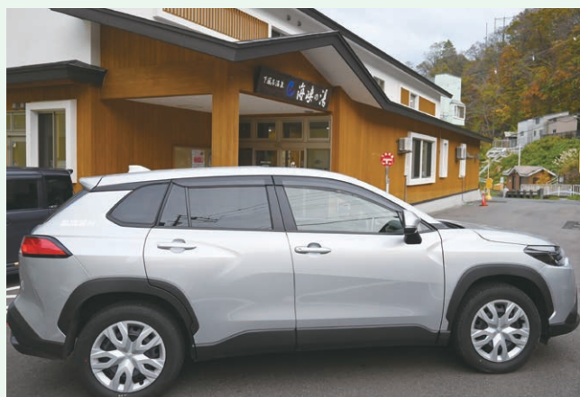
風間浦村災害等広報支援車両整備事業(風間浦村)