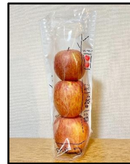
「ぷよりんご」袋イメージ