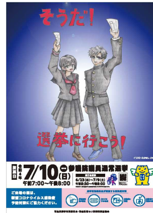
チラシ（高校3年生向け）