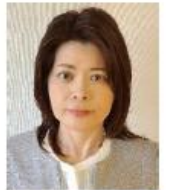
公益社団法人 日本広告審査機構 (JARO) 審査部

広告に関わる法律や、問題のある広告の具体的な事例を知り、広告を正しく読み取るポイントを学びます。