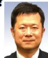
北里大学獣医学部 獣医伝染病学研究室 教授

感染症とは何か、わたしたちはどう感染症と向き合っていたらいいのかを最新情報とともに学びましょう。