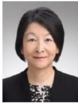
消費者庁 消費者教育推進課 課長補佐

昨年来の新型コロナウイルス感染症拡大を契機に言われ 終了 ようになった「新しい日常」。その中でどのような消費行動が求められているのかを消費生活の取組とともにご紹介します。