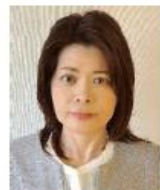
公益社団法人 日本広告審査機構 (JARO) 審査部

広告に関わる法律や、問題のある広告の具体的な事例を知り、広告を正しく読み取るポイントを学びます。