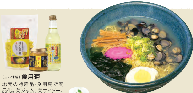
【三八地域】 食用菊 地元の特産品・食用菊で商品化。菊ジャム、菊サイダー、菊がゆなどに注目!