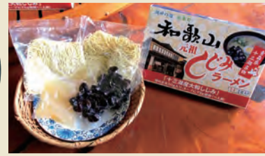
【西北地域】 しじみラーメン しじみラーメン発祥店の味に限りなく近い仕上がりのお土産用ラーメンを開発。