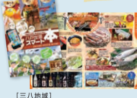
【三八地域】 「八戸出張スマート本」でまちあるき 仕事の空き時間に八戸出張者のための観光ガイドブックを利用して、観光スポット巡りやまちあるきができます。