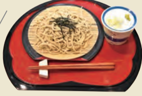
【上北地域】 上北そば 地産地消活動を加速させるために夏そばを開発。香りが豊かと評判。