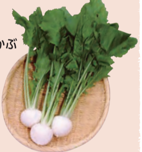
【三八地域】 ジュノハート 可愛いハート型で、最大級サイズは500円玉を超えます。2020年に全国デビュー! 6月末~7月上旬が旬。