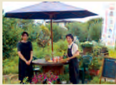
【中南地域】 農のふれカフェ 地元野菜や果物を使った料理やスイーツを味わえ、収穫体験も楽しめます。