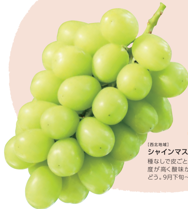
【西北地域】 シャインマスカット 種なしで皮ごと食べられる、糖度が高く酸味が少ない大粒がどう。9月下旬~10月下旬が旬。