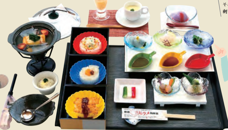
それぞれ違った味わいの刺身5点盛りがおすすめ