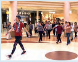
【西北地域】 モールウォーキング 健康維持、運動不足解消に向けてイオンモールつがる館で歩き方を学ぶイベント。