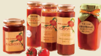
【東青地域】 トマト加工品 蓬田村産トマトの旨味が凝縮したケチャップなどの加工品が評判!