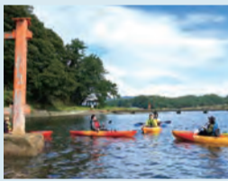
【東青地域】 海上アクティビティ ウォータースポーツのSUPやシーカヤックで、海上から浅虫の湯の島などを眺めるひと味違ったアクティビティ。