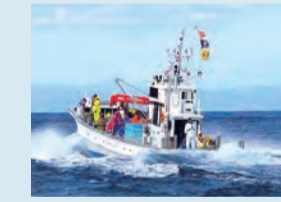
【下北地域】 海峡ロデオ大畑 網起こしなどの漁獲体験、むつ市大畑町産のサケ・マスを食べ比べが堪能できます。