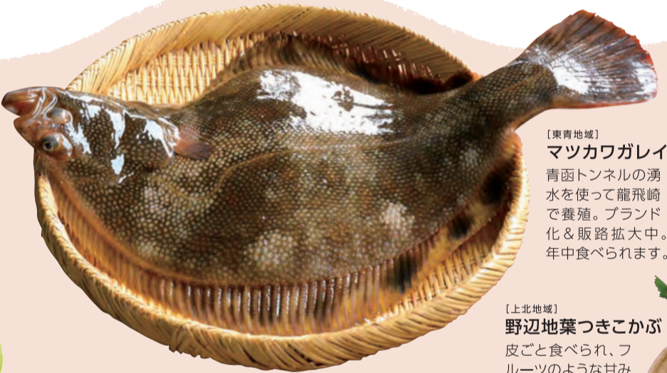
【東青地域】 マツカワレイ 青函トンネルの湧水を使って龍飛崎で養殖。ブランド化&販路拡大中。年中食べられます。