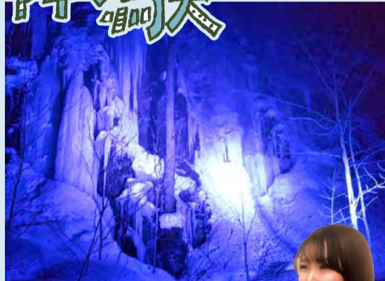
【上北地域】 冬の奥入瀬氷瀑ナイトツアー ライトアップされた夜の奥入瀬渓流の自然景観美が楽しめます。