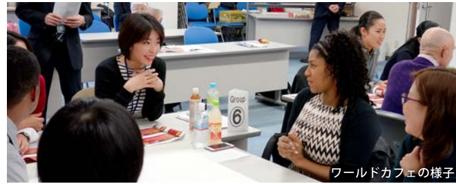
ワールドカフェの様子