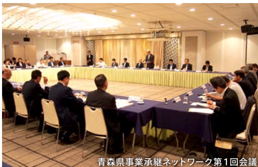
青森県事業承継ネットワーク第1回会議

内の事業承継の支援機関がオール青森で連携した支援を行うため「青森県事業承継ネットワーク」を組成しました。