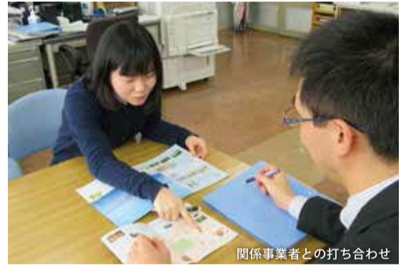
関係事業者との打ち合わせ