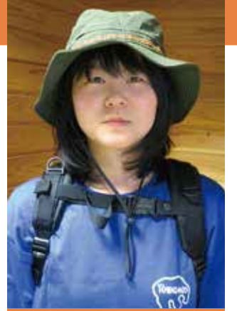
神 春花/奥入瀬溪流のコケに魅了された「コケガール」。休日には、多くの友人を現地まで案内して、コケの魅力力を力説している。