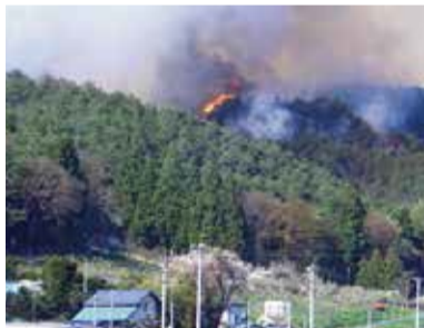
五戸町扇田の森林火災の様子(平成17年5月)

4月10日から6月10日までは「山火事防止運動強調期間」です。県内では4月から5月にかけて山火事が多く発生しており、その原因の多くは、たき火やたばこ火の不始末など、ちょっとした不注意によるものです。