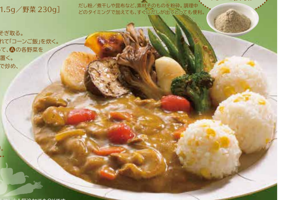
◎レシピ監修：総合販売戦略課 / 料理作成：長尾律子(青森県栄養士会会員)