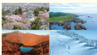
四季の自然美をドローンで撮影しPR

〈観光消費の拡大〉 新たな観光スタイルに応じた観光コンテンツの磨き上げや、新型コロナウイルス感染症の感染状況に連動したマイクロツーリズムなどの段階的な誘客促進に取り組みます。