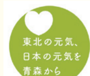
青森県震災復興シンボルマーク

※三陸ジオパーク：青森県八戸市から岩手県沿岸を縦断して宮城県気仙沼市まで続くジオパーク。平成25年9月に日本ジオパークとして認定されました。三陸ジオパークの活動は、東日本大震災からの復興にもつながるとともに、津波災害の経験や教訓を伝えることも目的としています。