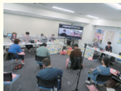
ハイブリッド型移住イベント

〈結婚・妊娠・出産・子育てしやすい環境づくり〉 結婚したい男女の希望を叶えることができるように、結婚支援対策を実施します。