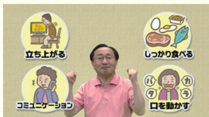
フレイル啓発動画

〈こころの健康〉 悩みを抱えた人の早期発見・早期対応に向け、関係機関の情報共有や相談窓口の普及啓発などを進めます。