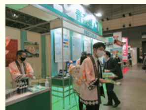
デジタルものづくりの誘致活動 （首都圏大規模展示会）

〈生産性向上・働き方改革〉 DX に対する経営者の意識改革に取り組むほか、農林水産業や建設業など、幅広い分野での DX を推進します。