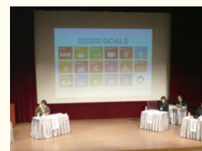
青森県SDGsフォーラム2021

〈多様な主体・人財の参画・協働〉 若者の参画促進、関係人口の創出・拡大など、地域活動の担い手の確保・育成に取り組みます。