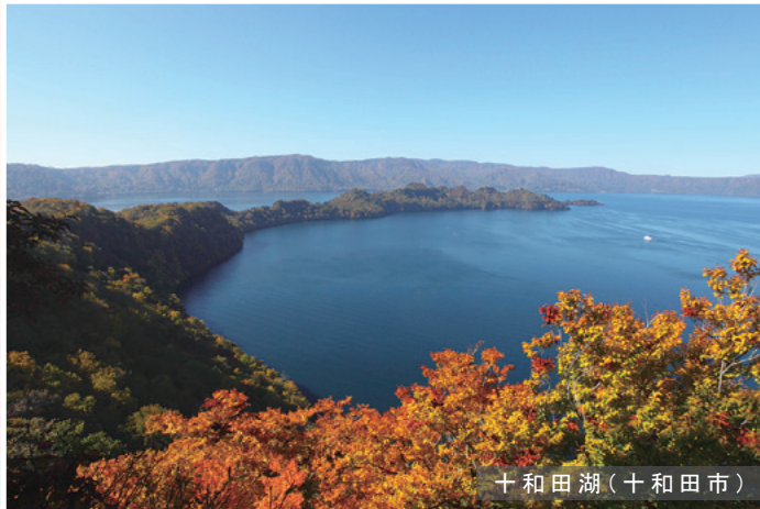
十和田湖(十和田市)