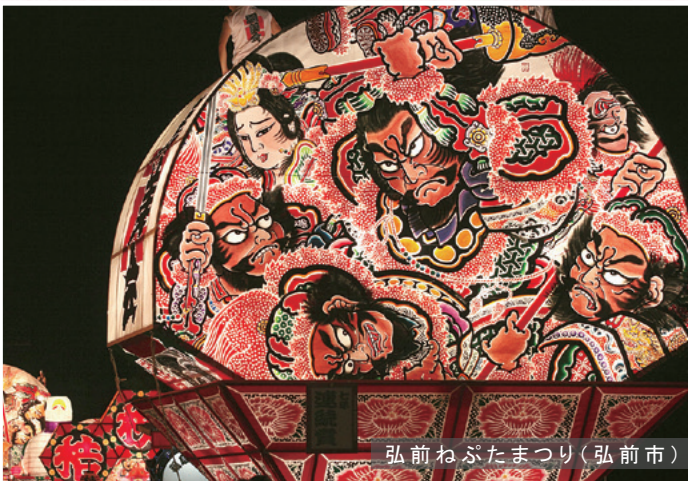
弘前ねぶたまつり(弘前市)