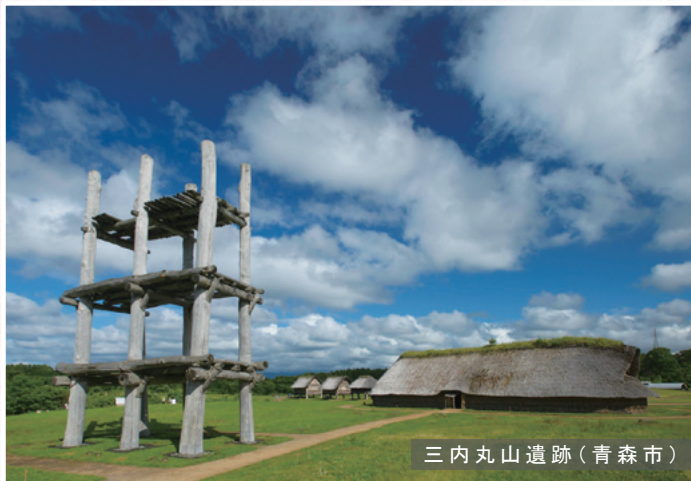
三内丸山遺跡(青森市)