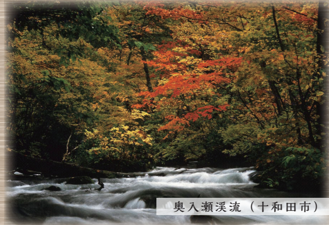
奥入瀬溪流（十和田市）