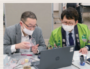
ウェブ商談会で海外のバイヤーに商品PRする県内事業者

〈生産性向上・働き方改革〉各産業におけるデジタル化やICT機器を扱う人財の育成に取り組みます。