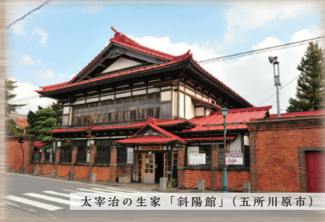
太宰治の生家「斜陽館」（五所川原市）