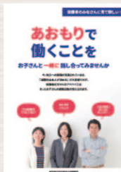
大学生の保護者向けリーフレット

〈結婚・妊娠・出産・子育てしやすい環境づくり〉保育人材の確保による保育環境の充実を図ります。