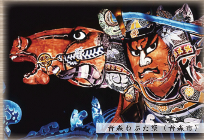
青森ねぶた祭（青森市）