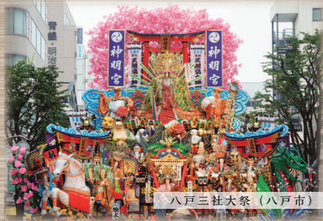
八戸三社大祭（八戸市）