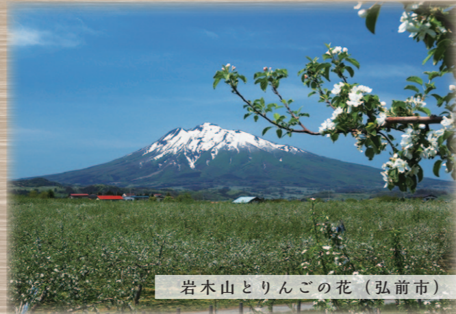
岩木山とりんごの花（弘前市）