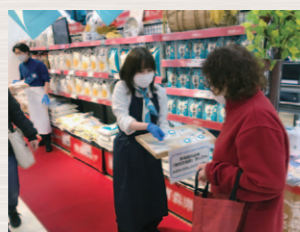
フードバックによる「青天の霹靂」のサンプル提供

〈観光消費の拡大〉コロナ禍における観光マインドを把握し、滞在型観光コンテンツを開発します。