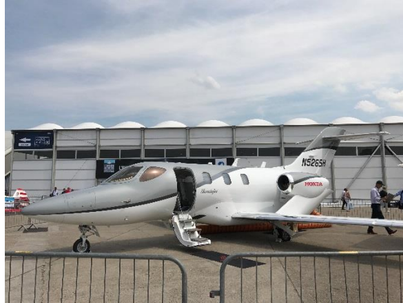
小型ジェット機脚部品（イメージ）