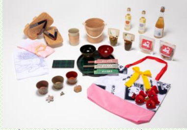
令和2年度ライフスタイル商品 ブラッシュアップ事業で開発した商品