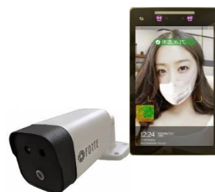
「体温検知顔認証システム 『MIDERA』シリーズ」 (株)フォルテ ～令和2年度認定商品～

※県では、当該認定商品を随意契約で購入することができるため、県での受注実績につながりやすくなります。