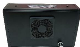
卓上型空気清浄機 「シクローネ」 (マトリクス(株)) ～令和3年度認定商品～