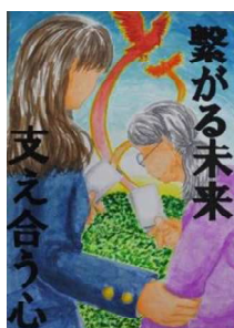
石沢 菜 八戸学院光星高等学校(3年)