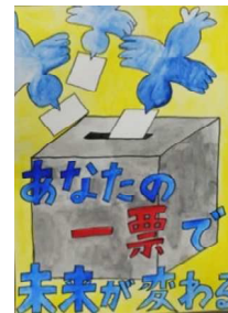
赤石 莉杏 六ヶ所村立泊小学校(6年)