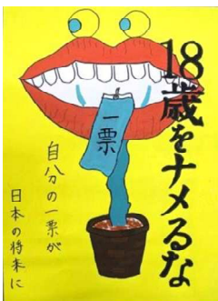
對馬 蓮 青森山田中学校(2年)