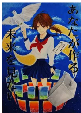
浜中 美音 県立弘前工業高等学校(3年)