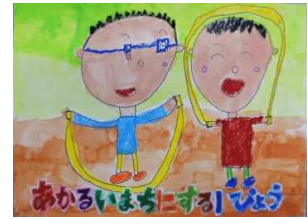
名古屋 勇琉 青森市立奥内小学校(2年)