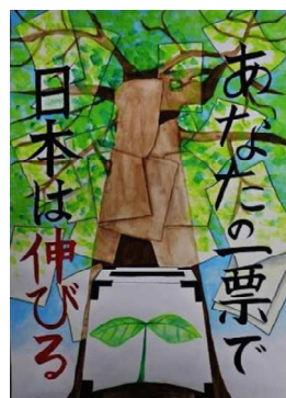
川村 奈々 八戸学院光星高等学校(3年)