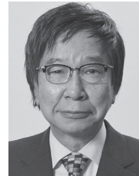
大門 みきし 1956年生まれ。 参議院議員4期、 党中央委員