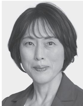
田村 智子 1965年生まれ。 党副委員長・ 政策委員長、 参議院議員2期