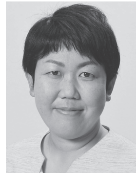
いわぶち 友 1976年生まれ。 参議院議員1期、 党中央委員