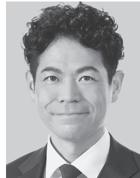
たけだ 良介 1979年生まれ。 参議院議員1期、 党中央委員