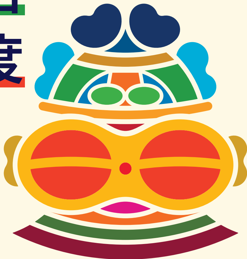
青森県SDGsロゴマーク

SDGsのゴールの達成に向けて 取り組む青森県内の法人等を 県が登録し、法人等の具体的な 取組を「見える化」することで、 SDGsに積極的に取り組む 法人等を後押しするための 制度です。