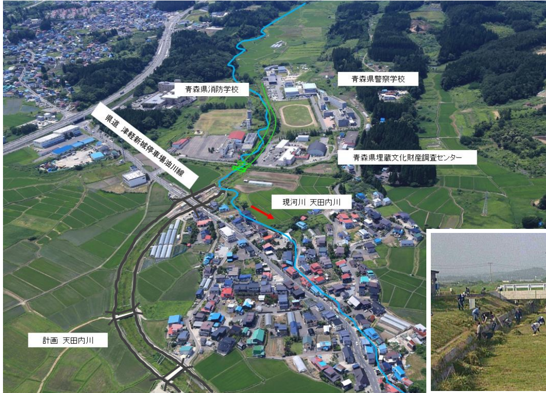
①地域住民の河川清掃