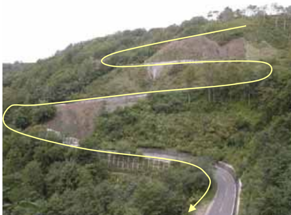
つづら折りの七曲区間