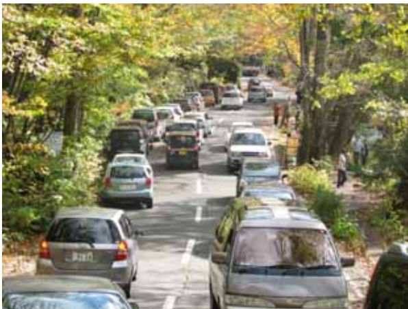
銚子大滝付近路上駐車