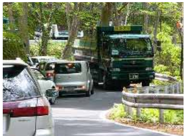
幅員狭小 すれ違い困難