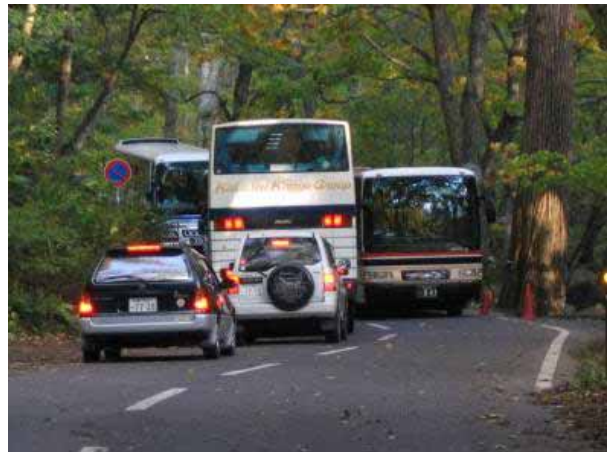
線形不良、狭隘区間