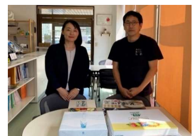
みらいねっと弘前様へお中元の寄付

〒039-1103 青森県八戸市長苗代3丁目6-9 電話：0178-20-8521