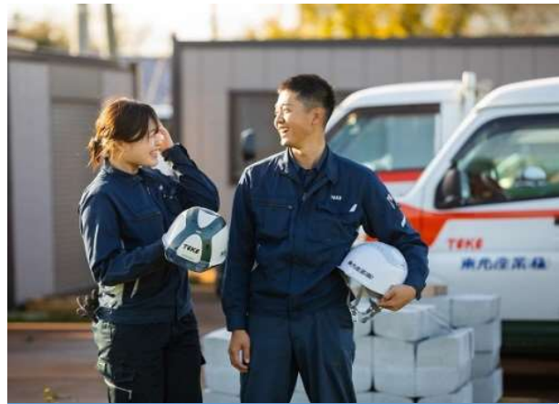
橋梁補修現場で活躍する若手社員

また、こどもの貧困問題や環境問題への意識を高め、地域課題を解決するための活動にも力を入れています。