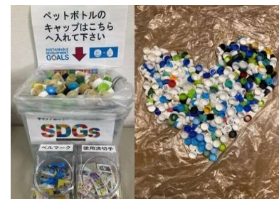
エコキャップワクチン運動