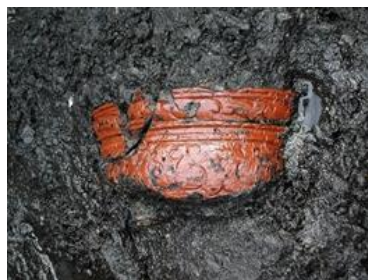
漆が塗られた容器（是川石器時代遺跡）