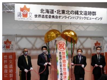
パブリックビューイング

その後、4道県と関係自治体では、構成資産の検討や課題を整理しながらユネスコに提出する推薦書案の作成や機運醸成に取り組みました。2018年、文化審議会世界文化遺産部会は「北海道・北東北の縄文遺跡群」を世界文化遺産国内推薦候補に選定しました。2019年12月に推薦が閣議了解され、翌年1月にユネスコに推薦書が提出されました。その後、世界遺産委員会の諮問機関であるイコモス（国際記念物遺跡会議）の現地調査を経て、2021年7月27日に開催された第44回世界遺産委員会拡大大会合において「北海道・北東北の縄文遺跡群（正式名称：Jomon Prehistoric Sites in Northern Japan）」が世界遺産一覧表へ記載されることが決議され、国内初の先史時代の世界遺産が誕生しました。