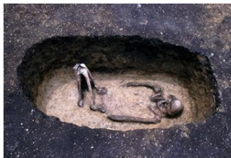
土坑墓（是川石器時代遺跡）