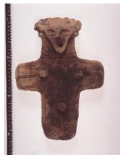
大型板状土偶 （三内丸山遺跡）