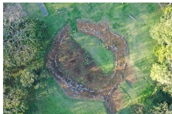
環状列石（小牧野遺跡）

北海道・北東北では、定住生活のごく初期から精緻かつ複雑な精神文化が発達しました。人々は、墓地をはじめ、祭祀・儀礼の場である捨て場や盛土、石を丸く配置した環状列石（ストーンサークル）などの施設をつくり、世代間、集落間で社会的なつながりを確認したとされています。