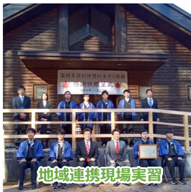
地域連携現場実習