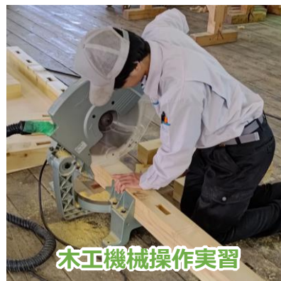
木工機械操作実習