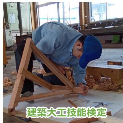
建築大工技能検定

職業能力開発促進法に基づく公共職業能力開発施設です。詳しくはWebで「むつ技専」を検索！ http://www.pref.aomori.lg.jp/soshiki/sangyo/mu-gisen_top.html