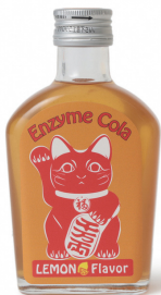
高品質・健康的な商品コンセプトを伝えるネーミングやパッケージを検討

県では、インバウンドの土産品購入需要に対応していくため、BEAMS JAPANと連携し、県内事業者の新商品開発や既存商品の改良・魅力向上を支援します！