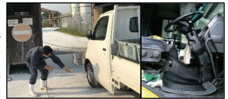
タイヤだけでなく、泥よけの内側まで消毒。フロアマットの交換やペダル等、車内も消毒。