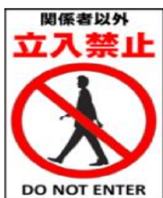
関係者以外の農場への立入を禁止