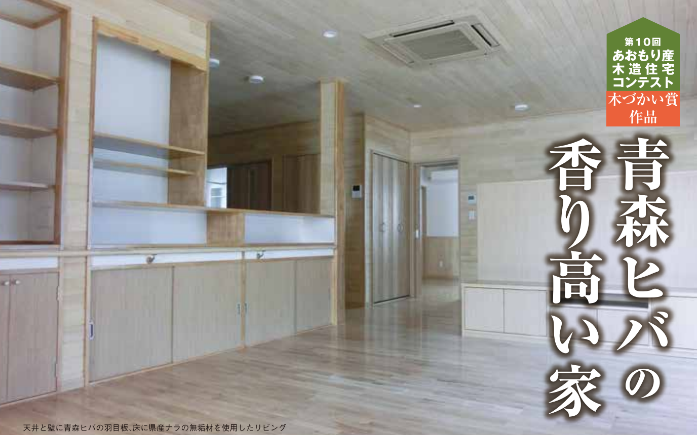
天井と壁に青森ヒバの羽目板、床に県産ナラの無垢材を使用したリビング

講評 この作品は、応募作品の中で も特に木材使用量が多く、住宅 の延べ床面積当たりの木材使用 量についても非常に多いことが評価さ れ、木づかい賞（審査員特別賞）に選ば れました。