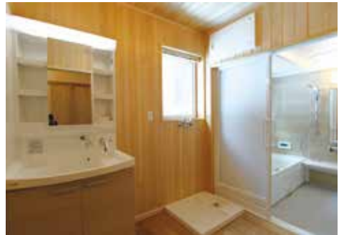
木肌が清潔感を醸し出す浴室まわり