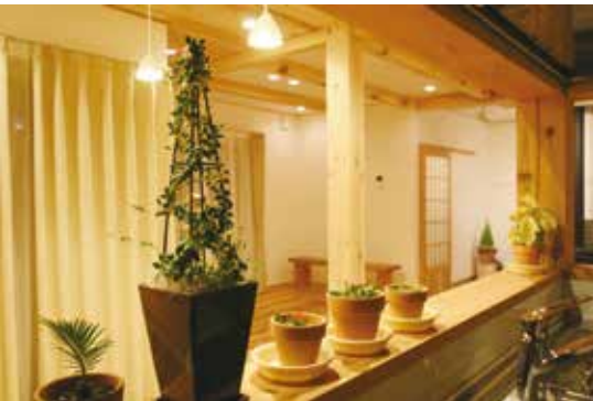
室内が見渡せる対面式のキッチン