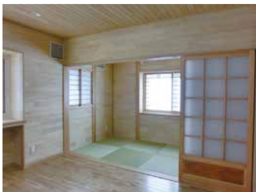
室内は段差のない安全なバリアフリー