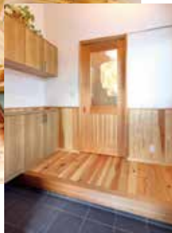
木のさわやかな香りが出迎えてくれる玄関ホール