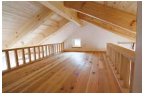
遊び心ある子供部屋のロフト