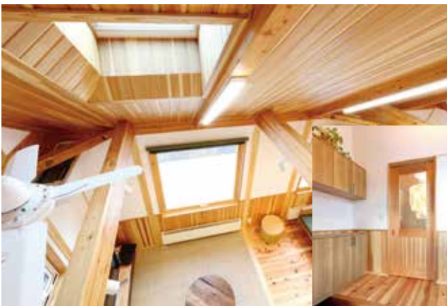
2階吹き抜け部分からリビングを見下ろす