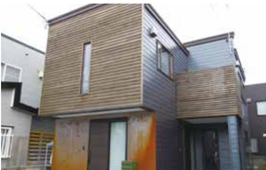
ネコちゃんも無垢の板が心地よさそう

に挑戦しています。 広い土間や趣味のディスプレイ など、施主様の生活が楽しく なる設計としながら、太陽光発 電の設置や熱効率にこだわり、 環境にも貢献しています。 高い住宅性能とデザイン性を 実現した県産材住宅として評価 され、優秀賞に選ばれました。 (川島委員長)