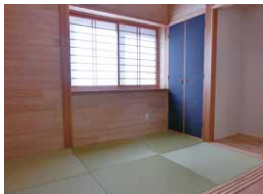
柱には4寸角の県産スギを使用