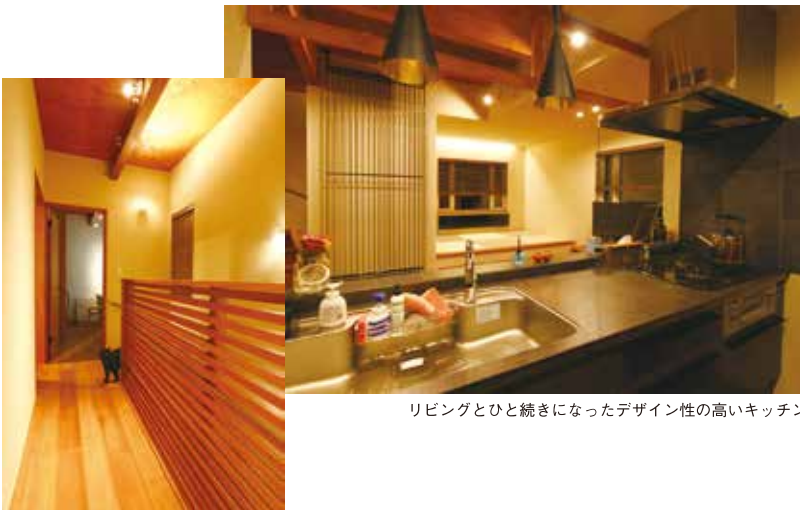
リビングとひと続きになったデザイン性の高いキッチン

に挑戦しています。 広い土間や趣味のディスプレイ など、施主様の生活が楽しく なる設計としながら、太陽光発 電の設置や熱効率にこだわり、 環境にも貢献しています。 高い住宅性能とデザイン性を 実現した県産材住宅として評価 され、優秀賞に選ばれました。 (川島委員長)