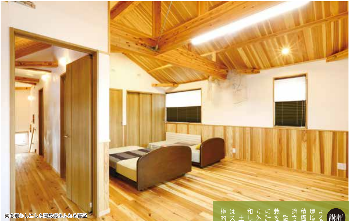
梁を現わしにした開放感あふれる寝室