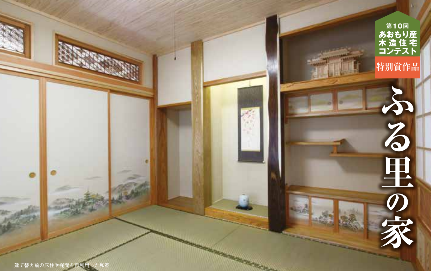
建て替え前の床柱や欄間を再利用した和室

講評 この作品は、平屋でどんな世代でも快適に生活できそう、昔ながらの純和風の雰囲気懐かしい、スギ、ナラ、クリなど様々な木を使い木のぬくもりを感じる、大黒柱が良い、ゆったり感がすてきーなど、落ち着いた木の空間が大変好評で、一般投票の結果、住んでみたいという声が最も多く、特別賞に選ばれました。 (川島委員長)