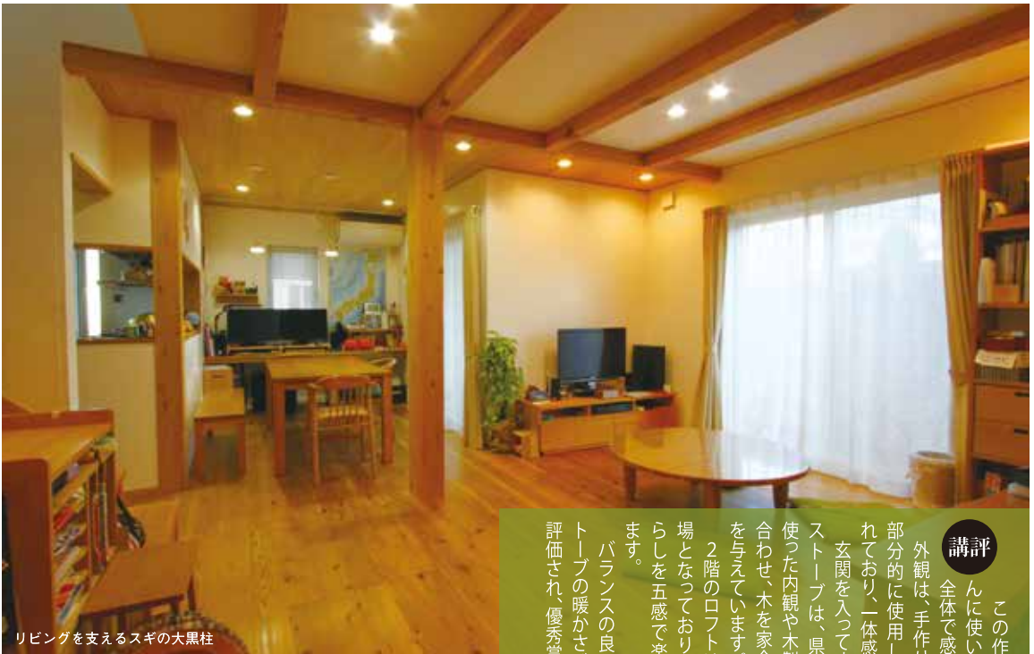
リビングを支えるスギの大黒柱