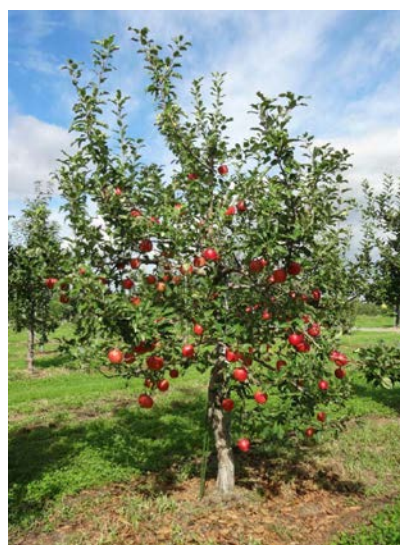
写真3 「紅はつみ」の樹姿