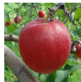
写真1 「紅はつみ」の果実