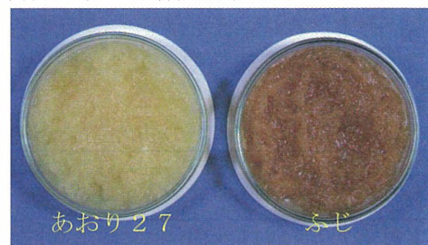
写真1 すり下ろし3日後の果肉色 (平成16年 青森農林総研りんご試)