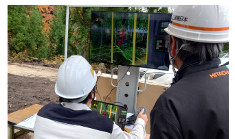
ICTハーバスタ研修会