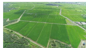
大区画に整備された農地