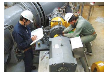
老朽化したポンプの機能診断