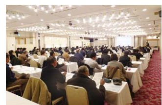
青森県中山間地域活性化研修会