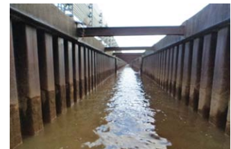
鋼矢板の腐食が進行している排水路