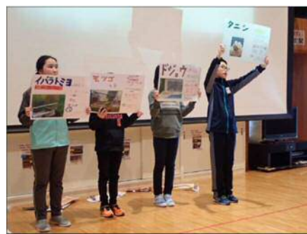
土場川の生き物について発表する児童

土場川地区関係農家の一部では、県が案内したタマネギ生産の先進地視察に参加し見聞を広めるなど、意欲的な動きが見られ、県も引き続き支援していきます。