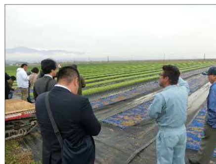
タマネギ生産先進地視察（長崎県）